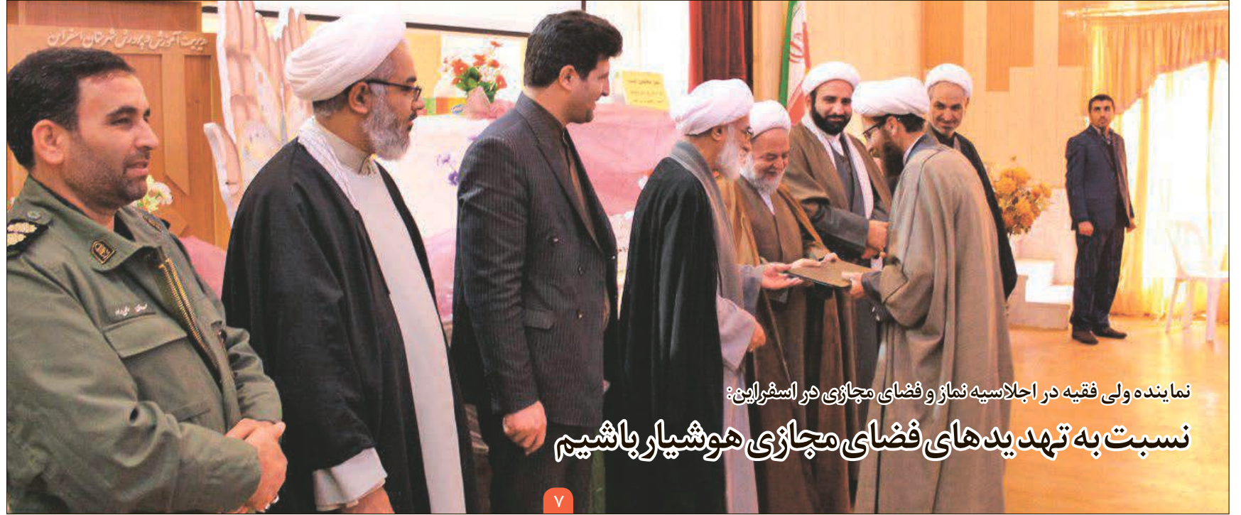
نماینده ولی فقیه در اجلاس هیئت نماز و فضای مجازی در اسفندماه

نسبت به تهدیدهای فضای مجازی هوشیار باشیم